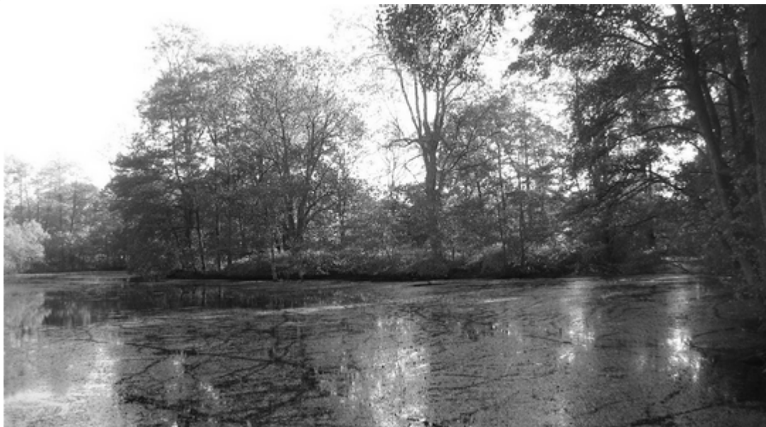
Die Burginsel im Lether Mühlenteich heute

1928 bildeten die Ruinen auf der vom Burggraben umgebenen Insel ein romantisches Plätzchen. Auch 1942 werden die Ruinen noch erwähnt. 1951 sollen sie restlos verschwunden gewesen sein. Alte Ahlhorner erinnerten sich in den 60er Jahren noch, „dat up de Insel grote Steinbrocken verschluchtert ligget un dat Schaope darup grästen“.